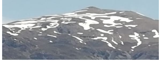
Picón de Jérez y Caballo 6– 6 -18

¡Atención ! Se aconseja evitar situaciones de riesgo, posibilidad de desprendimientos de nieve y rocas en paredes y escarpes, rotura de cornisas, rimayas y puentes de nieve sobre cursos de agua.