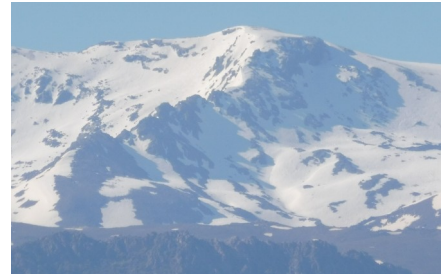
Corral y cumbre del Veleta y Cartujo 6 – 6 -18