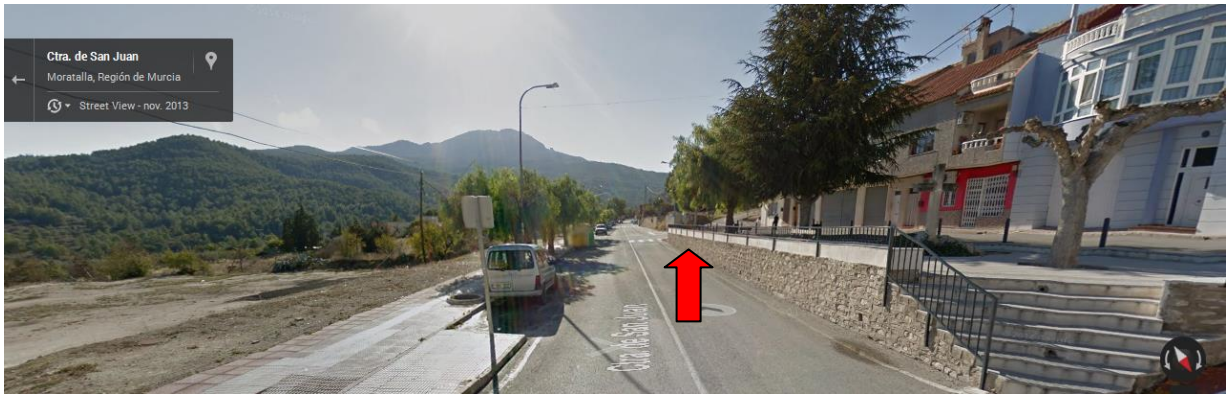
El punto de encuentro está a unos 100m.